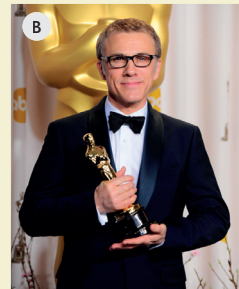
Christoph Waltz, Schauspieler