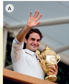
Roger Federer, Tennisspieler

Ich komme aus Basel, aber ich bin selten zu Hause. Sehr oft bin ich unterwegs und fliege von einem Turnier zum nächsten. Meine Erfolge bis jetzt sind: viele Jahre auf dem ersten Platz der Weltrangliste und Weltsportler in den Jahren 2005 bis 2008. Mein Spitzname ist FedEx oder auch Gentleman im Sport. Meine Familie ist für mich sehr wichtig.